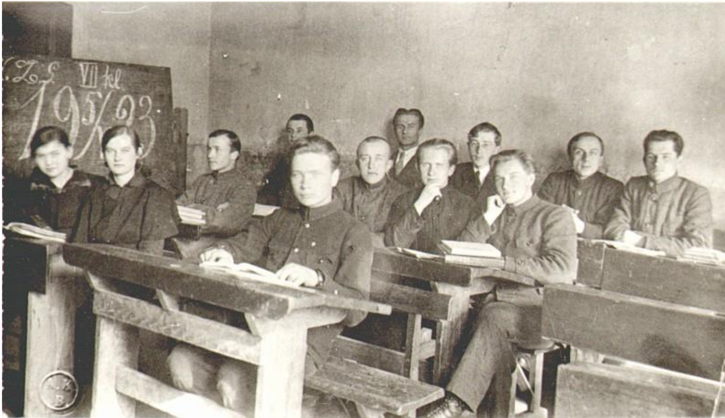
Poetė Salomėja Nėris tarp Vilkaviškio „Žiburio“ gimnazijos mokinių, 1923 m.