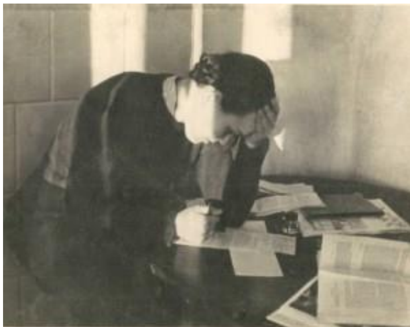
Kambaryje Palemone. Apie 1940 m.

Lietuvių poetė, lyrikė, subtiliausiai perteikusi moteriškąjį pasaulio jutimą, gyvenimo džiaugsmą ir skausmą.