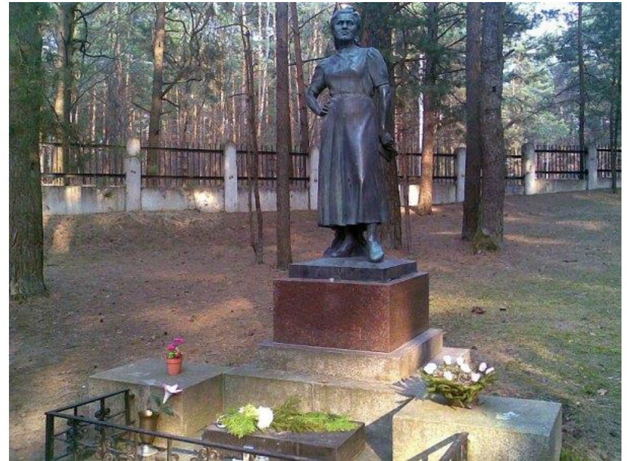
Salomėjos Neries kapas