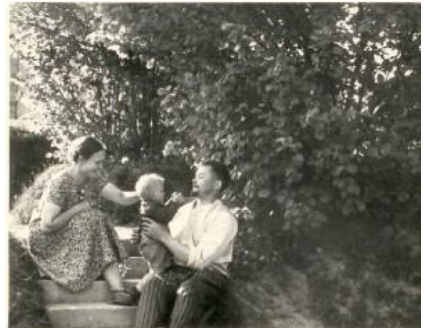
Salomėja Nėris su vyru ir sūnumi Palemone. Apie 1940 m.