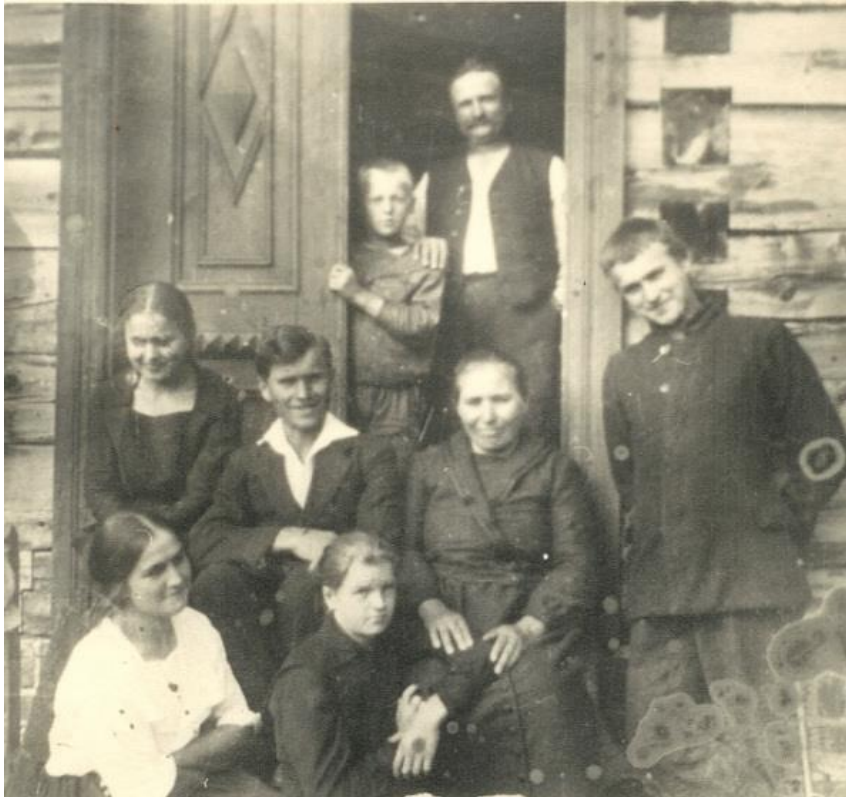
Salomėjos Nėries seneliai

Motina, Uršulė Žemaitytė-Bačinskienė, kaip ir visi jos giminės, išsiskyrė religingumu, pamaldumu, vienas jos brolis buvo kunigas.