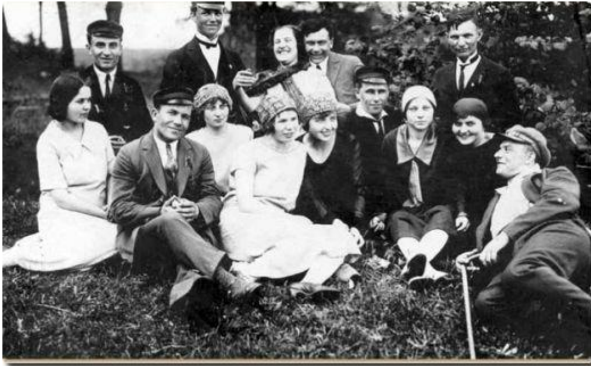
S.Nėris (pirma iš kairės) Kauno universiteto Teologijos-filosofijos fakulteto studentų ir profesorių gegužinėje Pajiesyje. 1926 m. gegužės 2 d.

Salomėja Nėris 1924-1928 m. studijavo Kauno universiteto Teologijos-filosofijos fakultete lietuvių literatūros, vokiečių kalbos ir literatūros specialybę