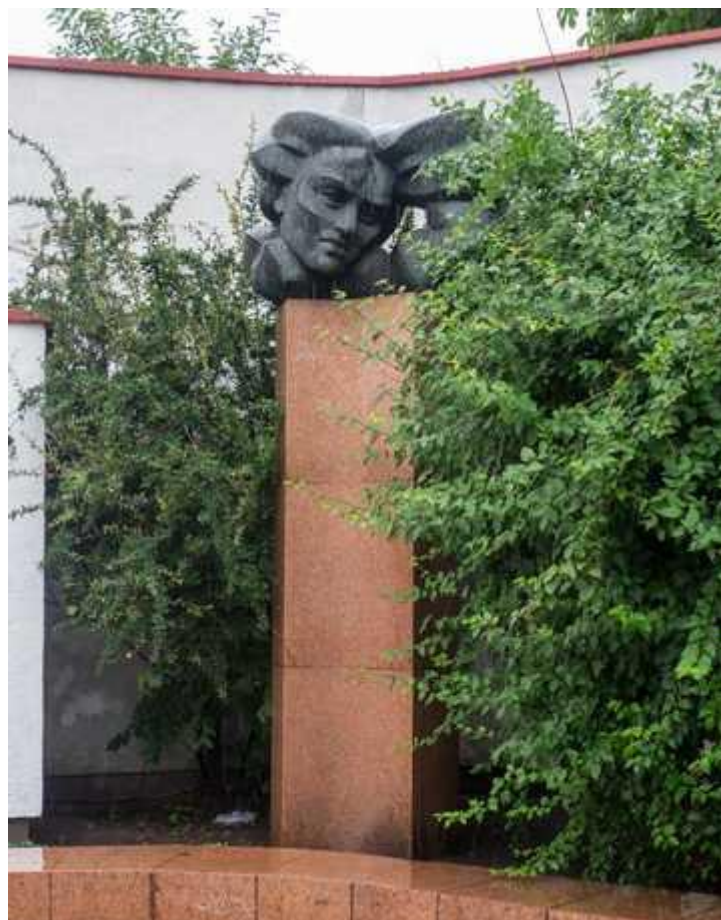
Salomėjos Nėries skulptūra (Vilnius), 1974 metais suprojektuota architektų Gedimino Baravyko ir Gyčio Ramunio. Skulptorius - Vladas Vildžiūnas