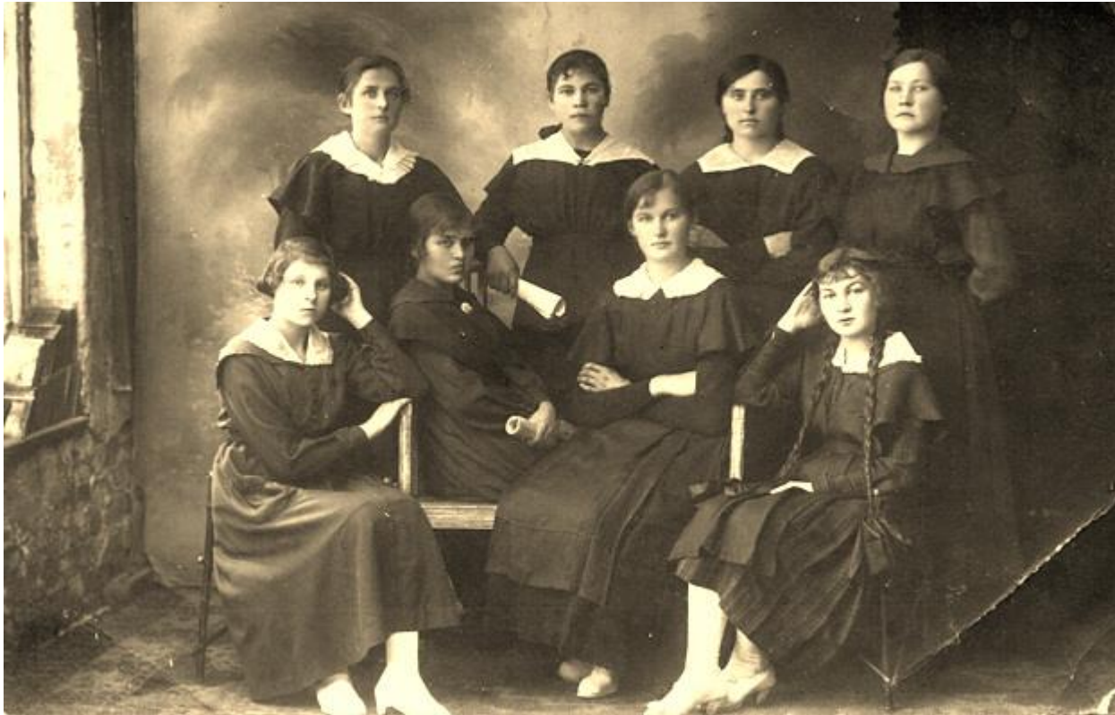
Vilkaviškio "Žiburio" gimnazijos mokinės. 1921 m. birželio 12 d.

Mokėsi Alvito pradžios mokykloje, Marijampolės progimnazijoje, vėliau – Vilkaviškio „Žiburio“ gimnazijoje.