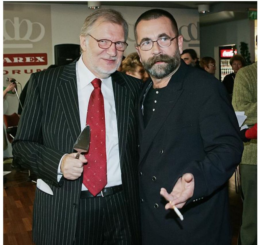
Juozas Budraitis ir Vytautas ir Kernagis (1951-2008)