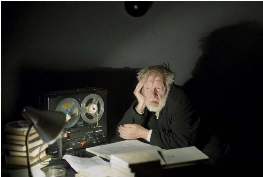
Spektaklyje „Paskutinė Krepo juosta“ (režisierius Oskaras Koršunovas) (2013 m.)