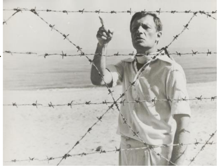
Filme „Savaitgalis pragare“ (1987 m.).

Juozas Budraitis baigė žymaus režisieriaus Vytauto Žalakevičiaus aukštuosius režisūros kursus Maskvoje. Filmas „Atspindžiai“ yra jo režisūrinis debiutas, kursinis darbas.