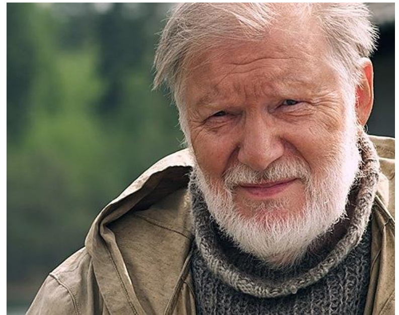
Filme „Baltosios rasos. Sugrįžimas“ (2014 m.)