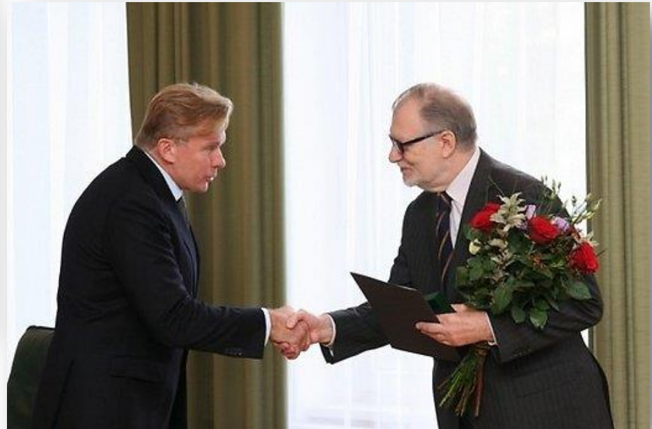
2010 m. Lietuvos užsienio reikalų ministras Audronius Ažubalis medaliu „Už nuopelnus Lietuvos diplomatinėje tarnyboje“ apdovanojo Lietuvos kultūros atašė Rusijoje Juozą Budraitį.