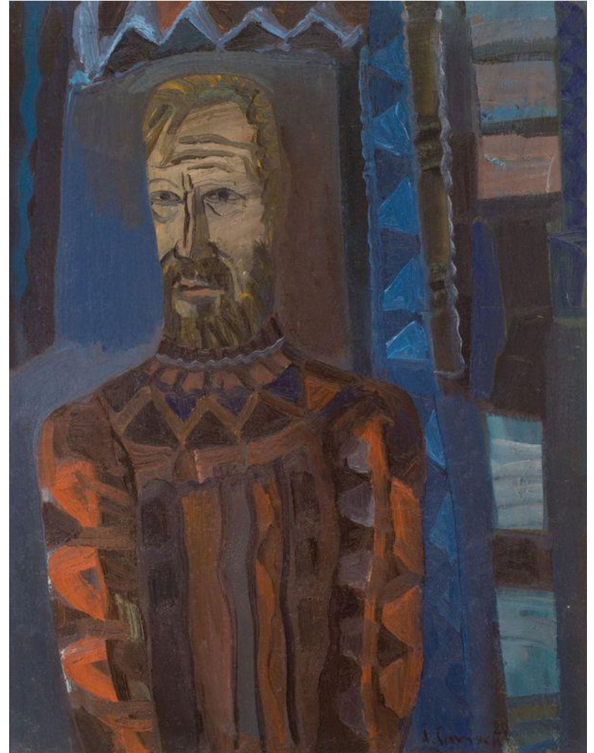
Autorius – Augustinas Savickas (1984 m.)