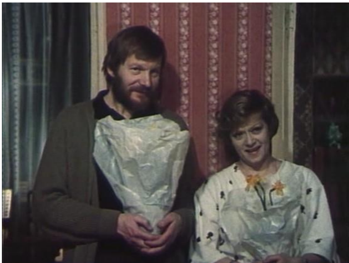
Filme „Pavojingas amžius“ su aktore Alisa Freindlich (1981 m.)