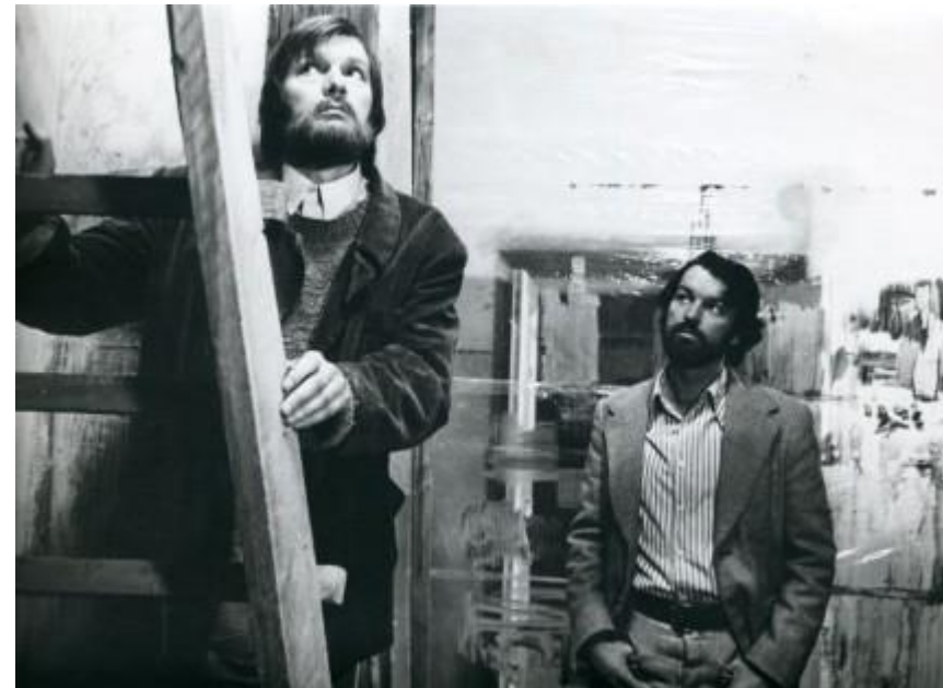
Petras filme „Sadūto tūto“ (1974 m.).