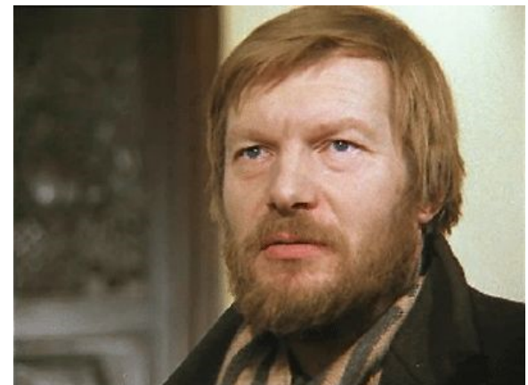
Filme „Pavojingas amžius“ (1981 m.).