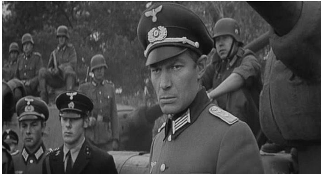
Filme „Skydas ir kalavijas“ (1968 m.).