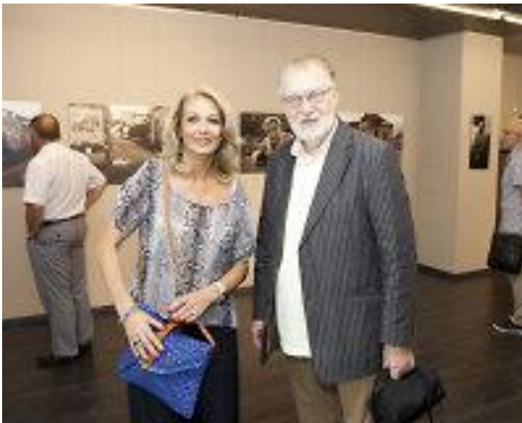
Gražina Baikštytė ir Juozas Budraitis