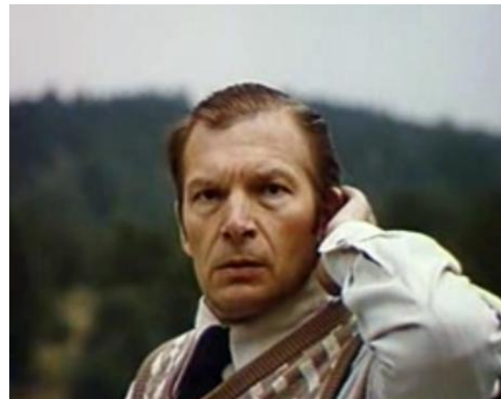
Filme „Faktas“ (1980 m.).