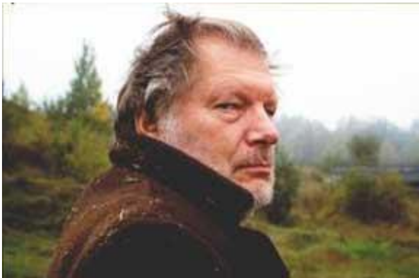
Filme "Paskutinis vagonas" (2002 m.).