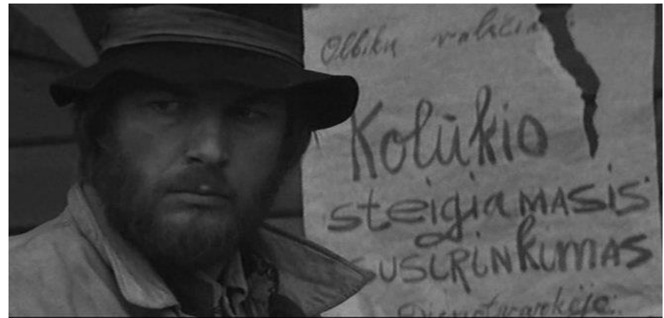
Filme „Vyry vasara“ (1970 m.).

Taip pat sukūrė vaidmenis filmuose „Kažkas atsitiko“ (1986 m.), „Savaitgalis pragare“ (1987 m.), „Neklausinėk manęs apie tai“ (1991 m.), „Klasikas“ (1998 m.), „Rusų maištas“ (1999 m.), „Anastasija Sluckaja“ (2003 m.), „Vilkogaudis“ (2006 m.), „Juodasis žaibas“ (2009 m.), „Tėve mūsų“ (2010 m.).