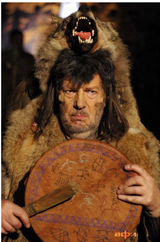
Filme „Ginkluotas pasipriešinimas“ (2009 m.)