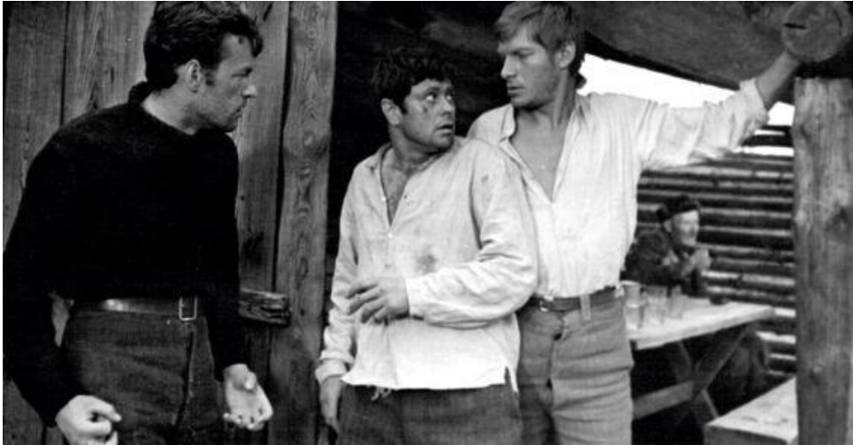
Pirmas stambesnis vaidmuo – J. Lokys filme „Niekas nenorėjo mirti“ (1965 m.).

Andrius filme „Jausmai“ (1968 m.), Ramonas – „Kentaurai“ (1978 m.), A. Ferfaksas – „Ferfakso milijonai“ (1980 m.), Dž. Stikeris – „Medaus mėnuo Amerikoje“ (1981 m.) ir kt.